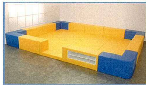
予定しているクッションフロアのイメージ

これはより重度の障害者に団樂の場を提供するもので、現在関連工事(別予算で実施する設置場所の整備=間仕切り撤去等)の細部仕様を詰めています。工事は今年3月末までに完了する予定です。